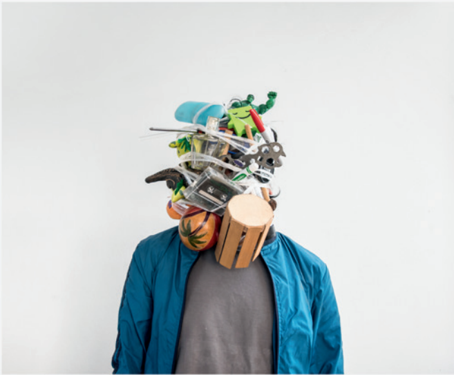
Jeisson Otálora Dislike Fotografía 10 x 10 cm c/u