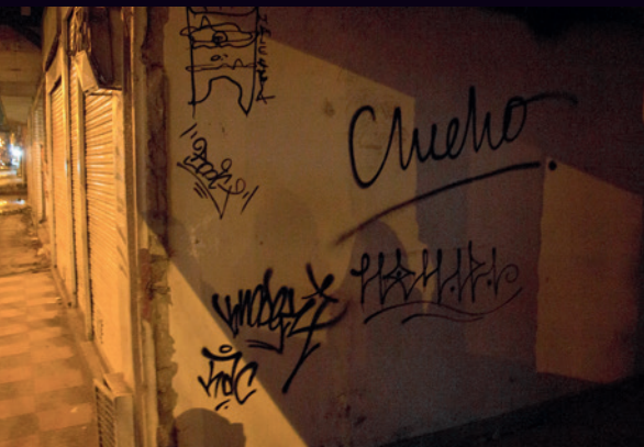
Izquierda: "Firmando demoliciones" Derecha: "Paredes que hablan"