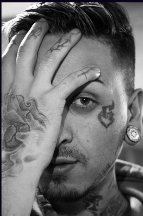
Izquierda: "Retrato Integrante la loquera producciones" Derecha: "Integrante La Loquera Producciones" Retrato impreso en papel bond 2018