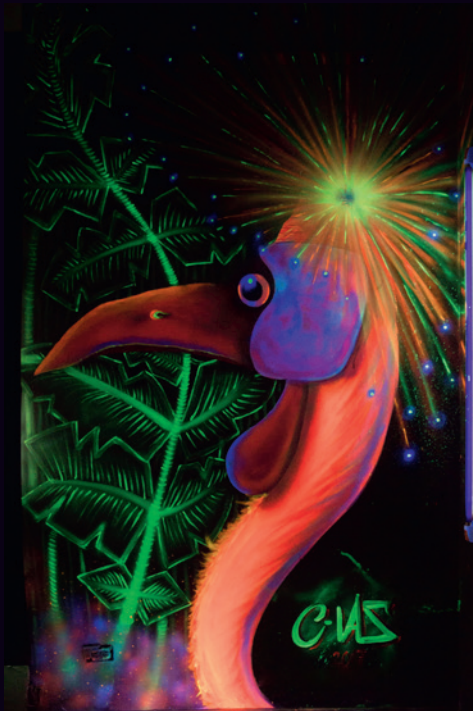
Cvaz Villalba, 2017 XX Festival Zaquesazipa Funza