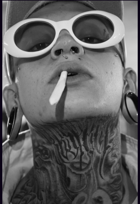
"Retratos. Tatuadores La Loquera Producciones" Retrato impreso en papel bond 2018