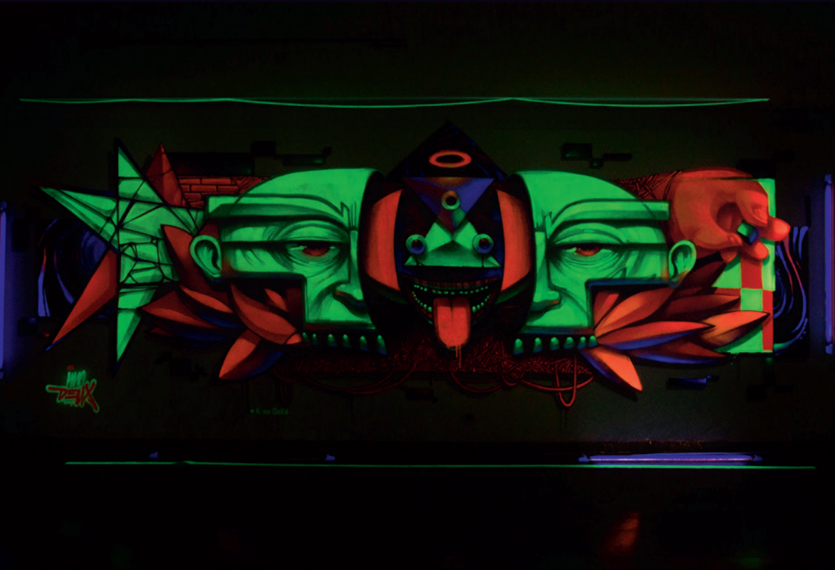
K-NO Delix, 2017 XX Festival Zaquesazipa Funza