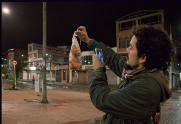
Izquierda: "Noches de expectación"