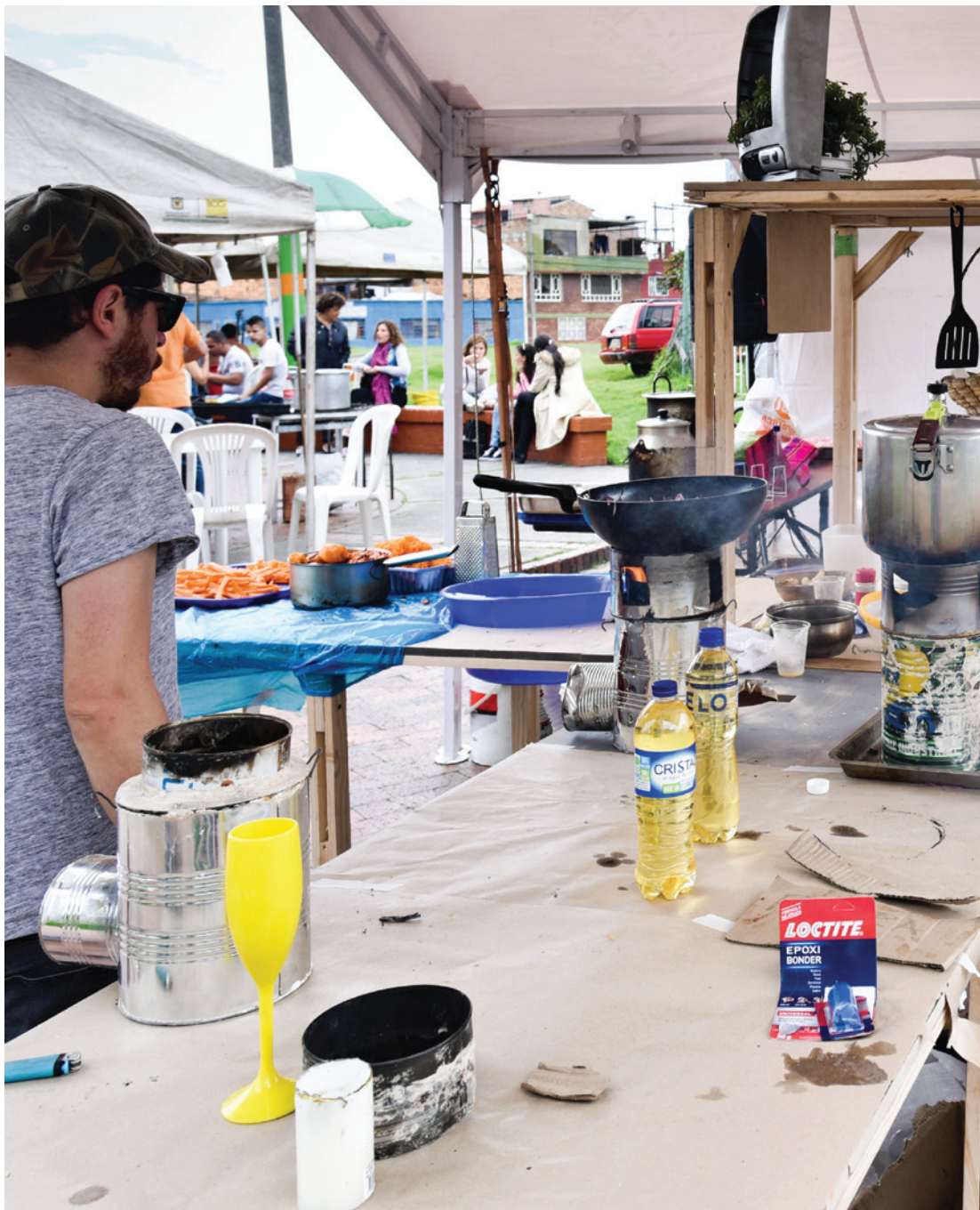
Sol de Noite + 'La buena chepa' Vol.4, 2018 Zona Autónoma Gastronómica, 2018 Intervención urbana en el mercado campesino del Parque Floralia el 5 de mayo de 2018