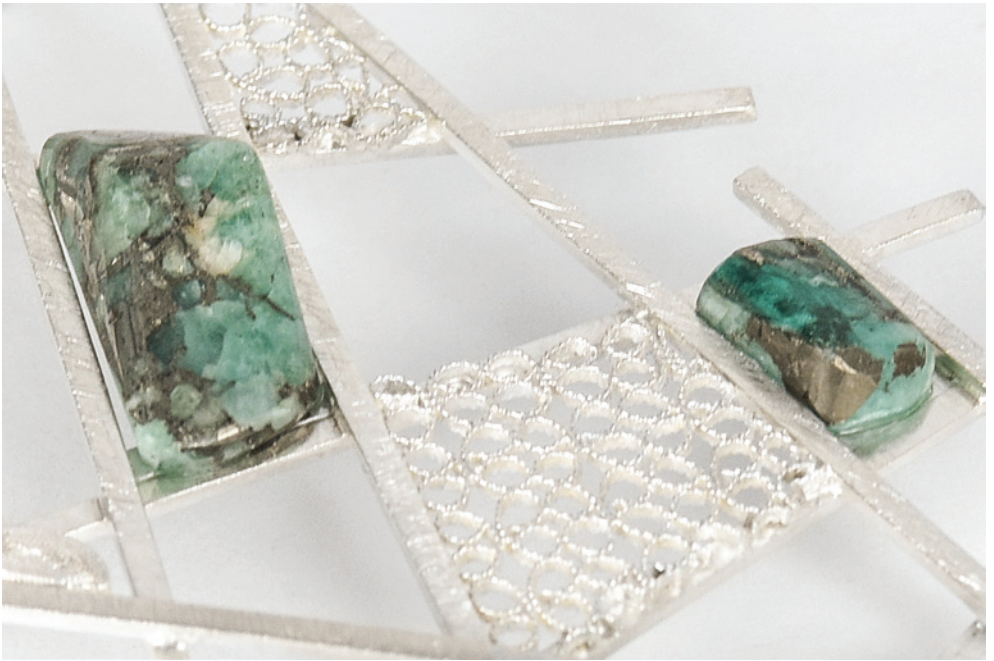
Tania Revueltas Conexión verde Aretes