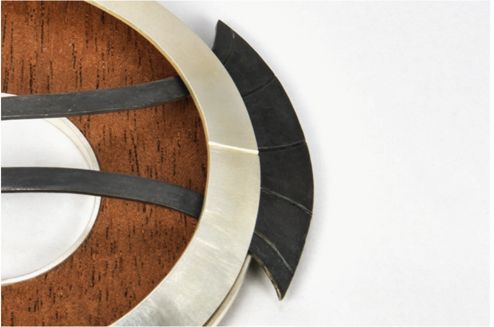
Nicolás Huertas 6.8.1538 Broche