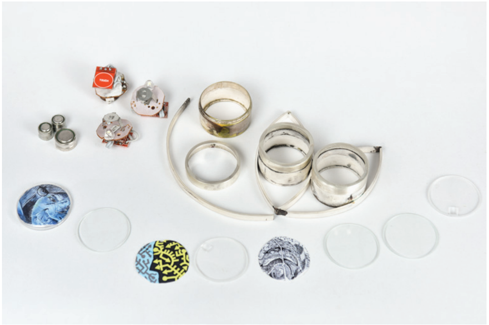
Diana Mendoza Tres miradas Broche