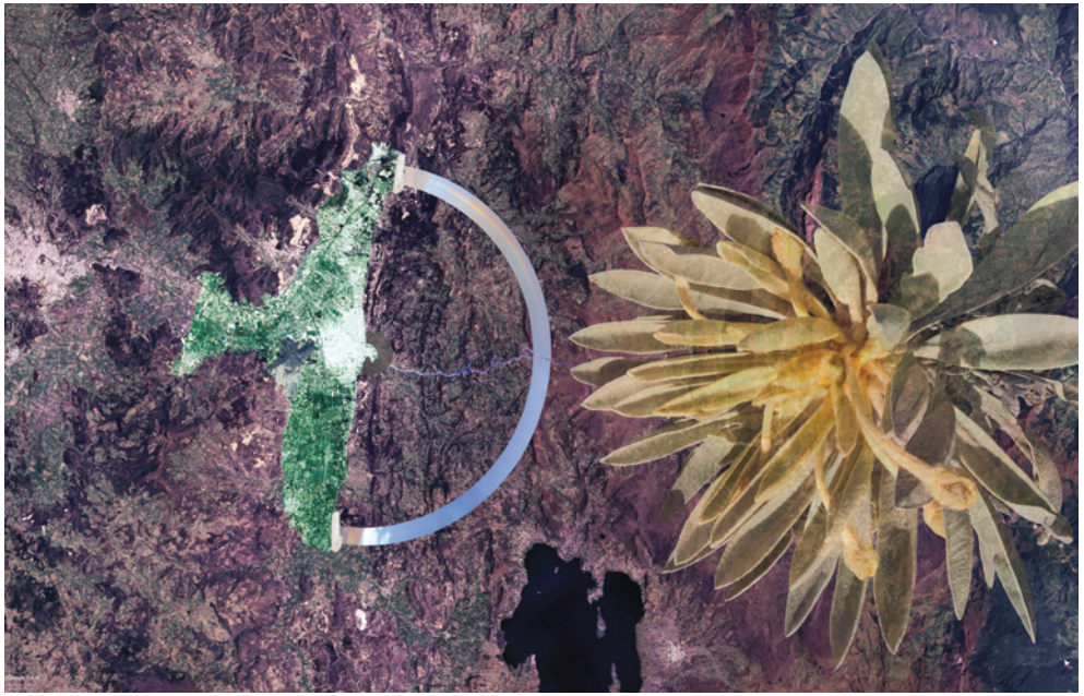
Erin Turner Pico del colibrí , 2019 Fotomontaje 50 x 30 cm