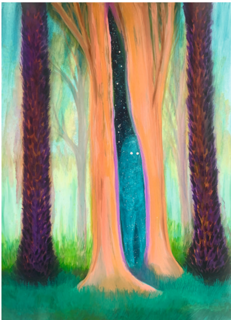
La piel del bosque , 2003. Óleo sobre lienzo. 140 × 100 cm