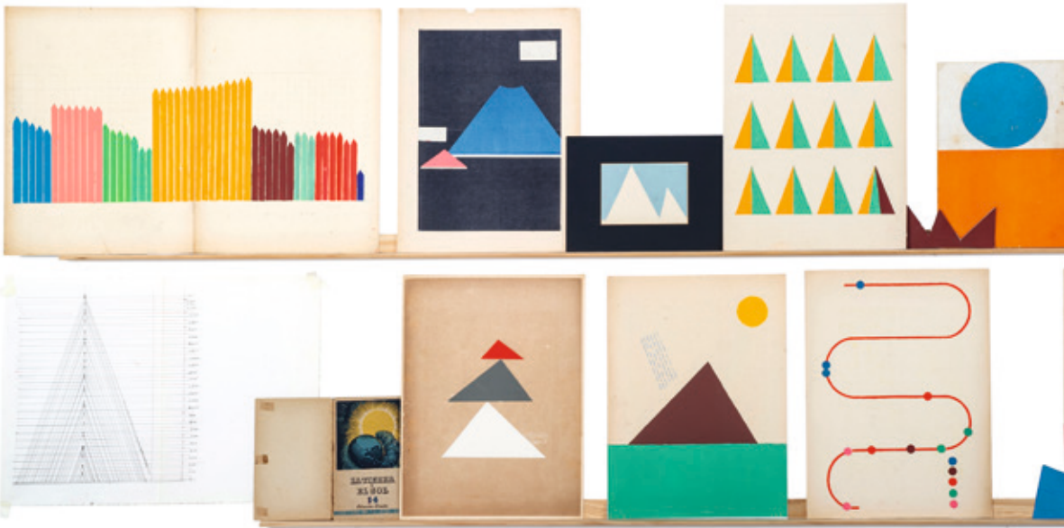
Geometría elemental , 2023.