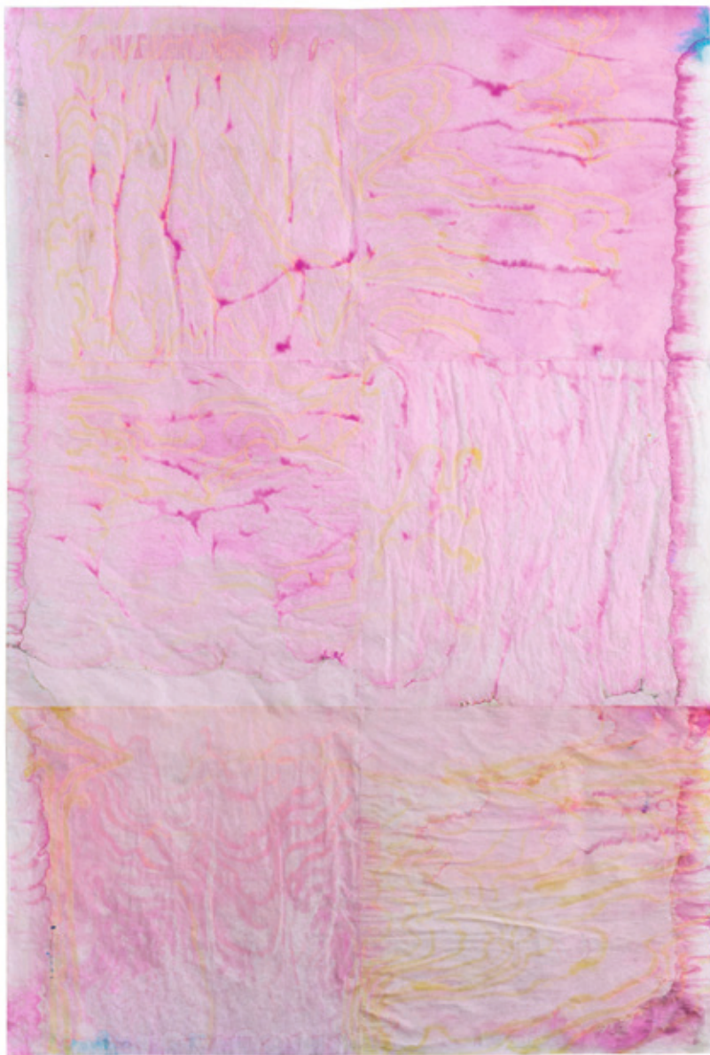
Ideas que se agrandan por los bordes , 2022. Técnica mixta sobre papel de filtro. 170 × 114 cm