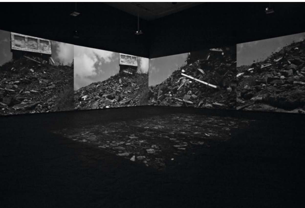
Duelos. Videoinstalación multicanal. 9 proyecciones. Sonido 11.3