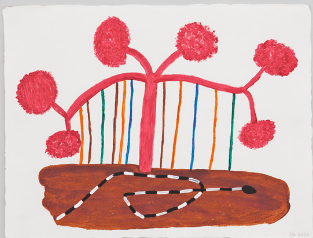
Thoo thope hii wake hihami (Árboles rojos con bejuco), 2023 Acrílico sobre papel de algodón. 29.5 × 39.5 cm